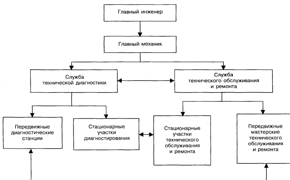
Рисунок 3 - Блок-схема управления диагностированием, техническим обслуживанием и ремонтом в механизированной строительной организации

7.12 Диагностирование может осуществляться в полевых условиях (на местах работы машины) или на стационарных участках.